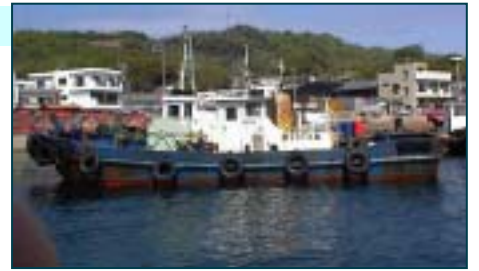
三菱重工 6PK-1 番号 610076

船舶番号: 第270 - 38736号 航行区域: 沿海区域 総トン数: 9.70トン 長さ: 11.91m 幅: 3.84m 深さ: 1.47m 主機馬力: 120PS