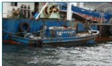
ヤンマーディーゼル 6G-H50 0545

船舶番号： 第270 - 36413号 航行区域： 沿海区域 総トン数： 13.43トン 長さ： 7.67m 幅： 3.00m 深さ： 1.20m 主機馬力： 165PS