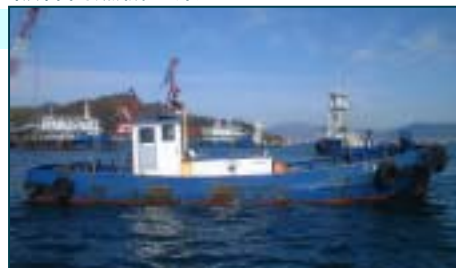
ダイヤディーゼル 6G-2 620376

船舶番号： 第270 - 21465号 航行区域： 平水区域 総トン数： 13.43トン 長さ： 11.95m 幅： 3.80m 深さ： 1.35m 主機馬力： 120PS