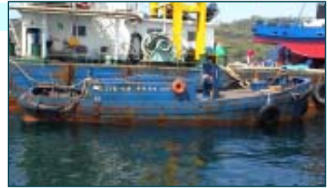
ヤンマーディーゼル 4ESDG DESN2454

船舶番号: 第260 - 16861号 航行区域: 沿海区域 総トン数: - 長さ: 8.40m 幅: 3.00m 深さ: 1.06m 主機馬力: 55PS