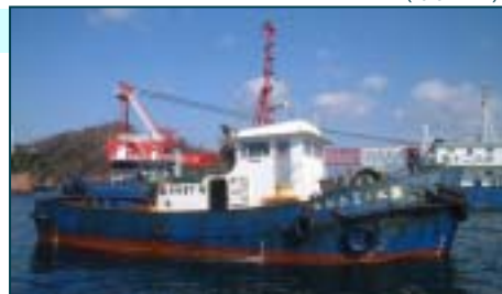
昭和精機 6LAAK-UT 5320

船舶番号： 第270 - 37046号 航行区域： 平水区域 総トン数： 17.00トン 長さ： 11.95m 幅： 4.98m 深さ： 1.92m 主機馬力： 450PS