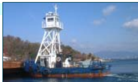
ヤンマーディーゼル 6N160-EN FJR1676/1677(右/左)

船舶番号： 第270 - 40959号 航行区域： 沿海区域 総トン数： 19.00トン 長さ： 11.90m 幅： 5.98m 深さ： 1.95m 主機馬力： 760PS×2