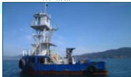
阪神内燃機工業 6LUDA26G LU26-95

船舶番号： 第270 - 40488号 航行区域： 沿海区域 総トン数： 19.00トン 長さ： 11.95m 幅： 6.00m 深さ： 2.38m 主機馬力： 700PS