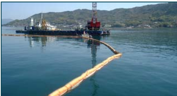
シルトプロテクター設置